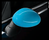
Außenspiegelkappen in Shocking Blue 2