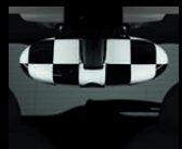
Innenspiegelkappe Checkered Flag