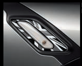
Side Scuttles Black Jack