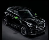
MINI RAY Paket in Alien Green 1