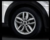
Double Spoke R124 in Silber, Größe 7 J x 17 Zoll, Winterrad