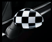
Außenspiegelkappen Checkered Flag