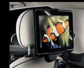
Travel & Comfort System Halter für Apple iPad (2-4) / iPad mini