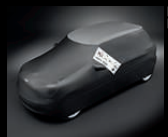
Car Cover In- und Outdoor