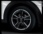
5-Star Double Spoke Composite R127 in Schwarz, Größe 7,5 J x 18 Zoll