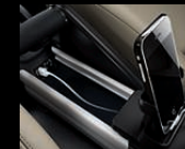
Universalhalter für Mobile Devices