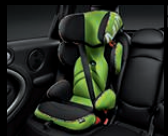
MINI Junior Seat Gruppe 2/3