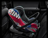
MINI Baby Seat Gruppe 0+