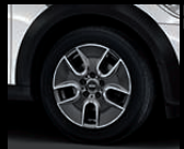
Tunnel Spoke R125 in Anthrazit, Größe 7 J x 17 Zoll